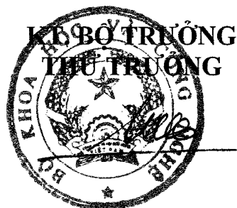
Phạm Công Tạc